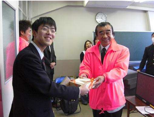
優勝 : 岐阜県立飛騨神岡高校