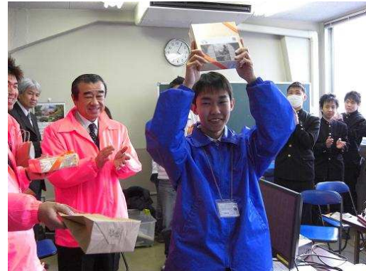
準優勝 : 名古屋工学院専門学校 高等課程